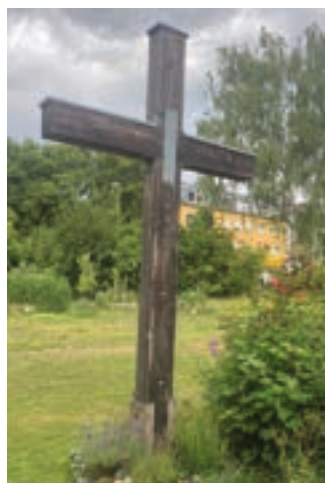
St. Johannes