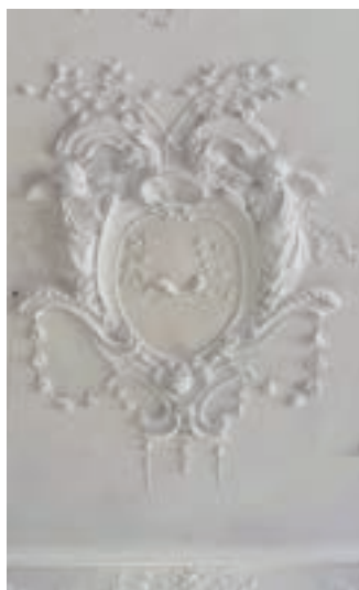
St. Ulrich, Foto: Schmeckenbecher

9:30 St. Johannes GZ , Gottesdienst (Aujezdsky) 10:00 St. Anna , Gottesdienst (Hegner) 10:00 Heilig Kreuz Gemeindesaal, KiGo-Plus (KiGo-Team) 10:00 St. Jakob , Seelenherberge - Gottesdienst in besonderer Form (Burkhardt) 10:30 St. Ulrich , Gottesdienst m. AM (Schmeckenbecher)